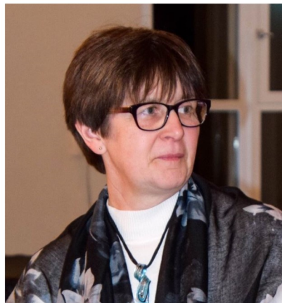
Õpetaja Siiri Vaht .