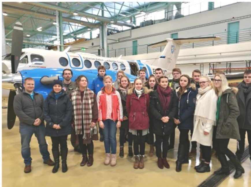
Sisekaitse kutseõppe õpilaste reis Tallinna