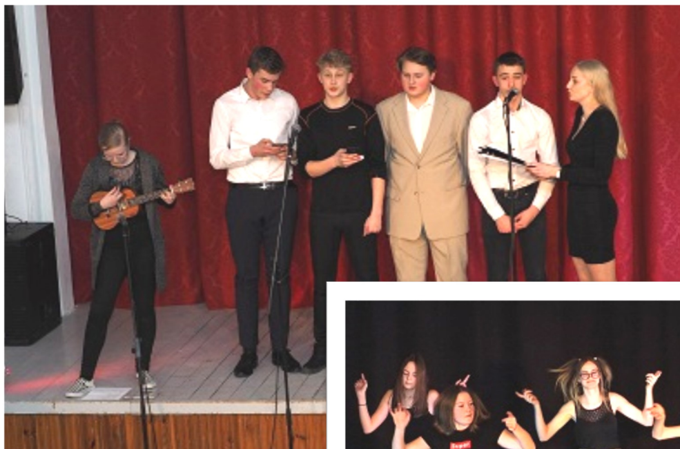
Poistebänd ja tantsijad.