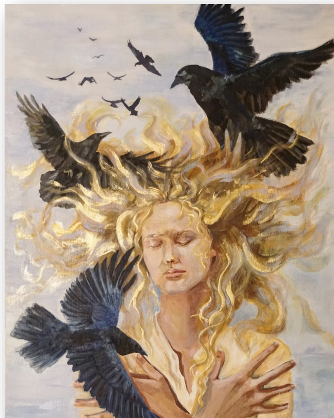
Maal „Õe mure”, autor Angela Lauge